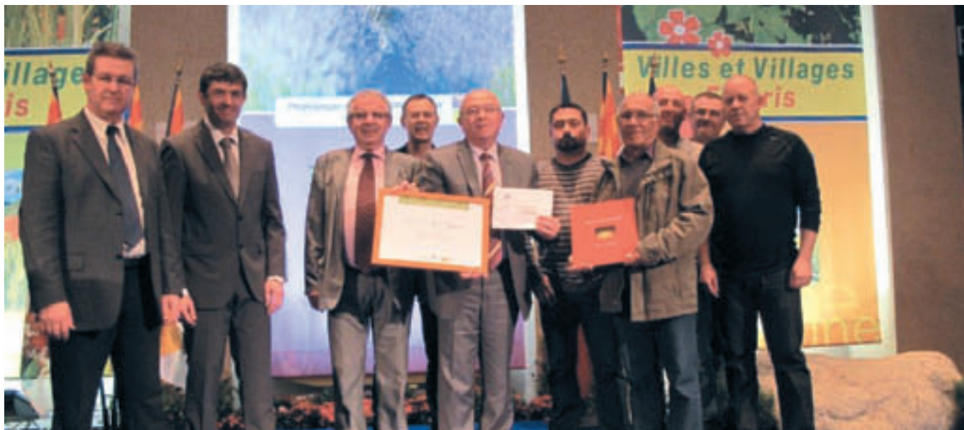
A l'hôtel de Région, la délégation grysiéenne reçoit le diplôme de la 3 e fleur