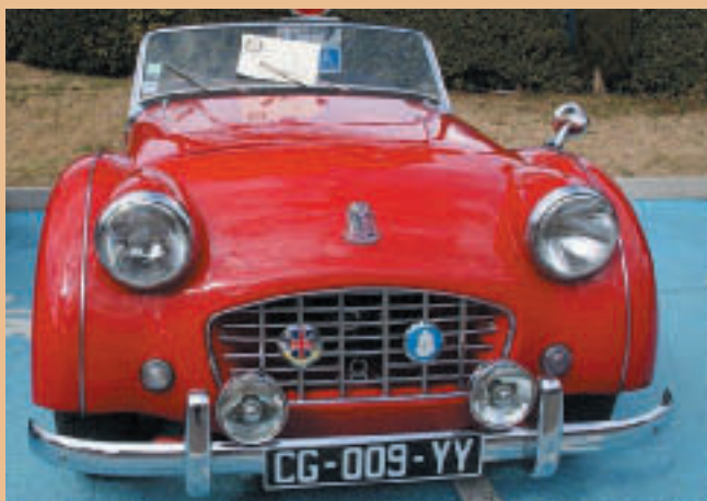
Une rutilante Triumph