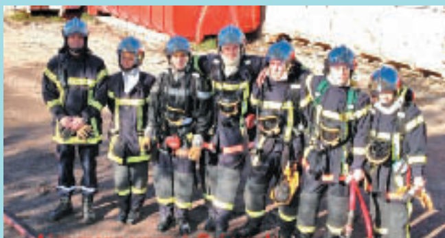
La première manœuvre de l'année

Le Chef de Centre des Sapeurs-Pompiers de Gréoux nous livre des informations sur l'été « Chaud » 2012 mais pas dramatique au niveau des feux de forêts puisque deux départs de feu (à la Colle et route de Vinon) ont été très vite maîtrisés.